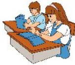
くにたちキッズインターナショナルスクール(プリスクール・キンダーガーデン) 東京ウエストインターナショナルスクール(小学部)

9月からのキャンパス移行に際しまして、ご父兄の皆様のご理解、ご協力をお願いいたします。