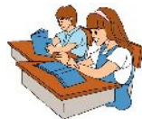
Kunitachi Kids International School ( Preschool & Kindergarten ) Tokyo West International School ( Elementary )

We appreciate your understanding and co-operation for our campus relocation on September